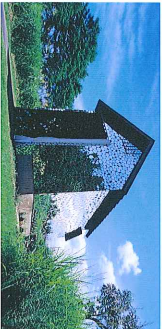
「BACCA * GOHGI」